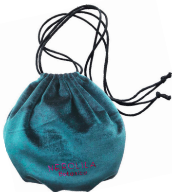
オリジナルショルダーポーチ W180mm×H180mm×D110mm 冬らしい深いグリーンのリッチなベロア生地に、フューシャピンクのロゴ入り。ころんと丸いフォルムのショルダーポーチは、肩からかけてちょっとしたお出かけにも。