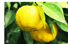
高知県産ユズセラミド

〈オイル層〉クランベアピシニカ種子油、ホホバ油、オリーブ油、アルガンオイル、シアバター、コメ胚芽油、ユズ果皮油、セージ油、オレンジ果皮油、ラベンダー油、ビターオレンジ油 〈美容水層〉米セラミド、ユズ果実エキス、茶葉エキス、サガラメエキス、スサビノリエクス、ショウガエキス