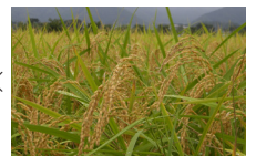
北海道産コメセラミド